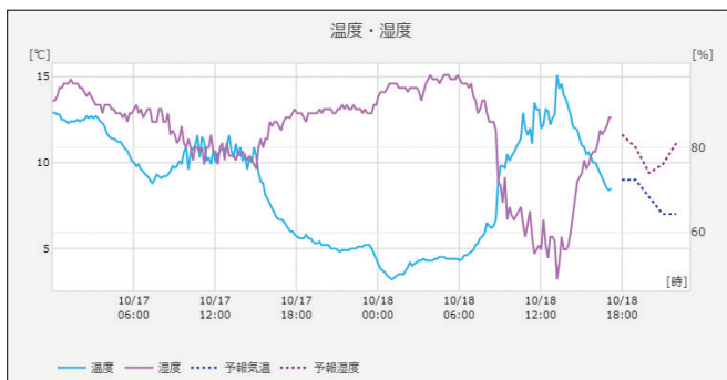
■温度・湿度 計測グラフ