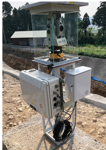
コンクリート基礎