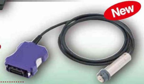
SWT-9000 シリーズ専用プローブ FN-325