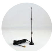
ケーブル付 ワイヤーアンテナ