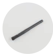
ショートアンテナ